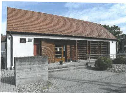
Az Alapszolgáltatási Centrum épülete