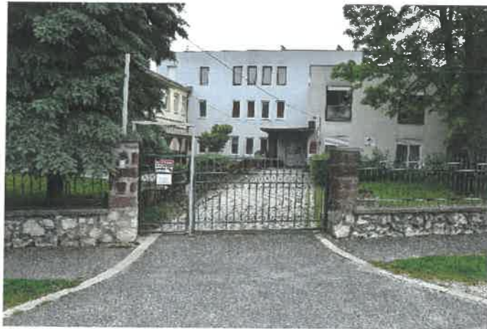
- Virágoskert Idősek Otthona