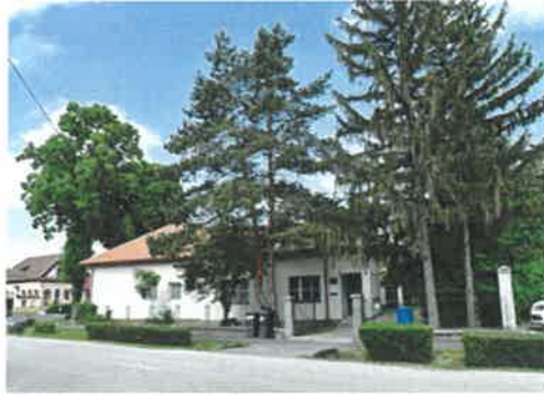
Lébényi Idősek Klubja