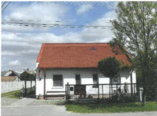
Jánossomorjai Idősek Otthona